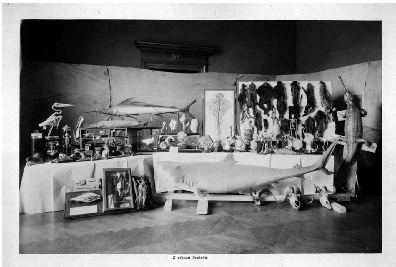
Z odkazu Jirušova.