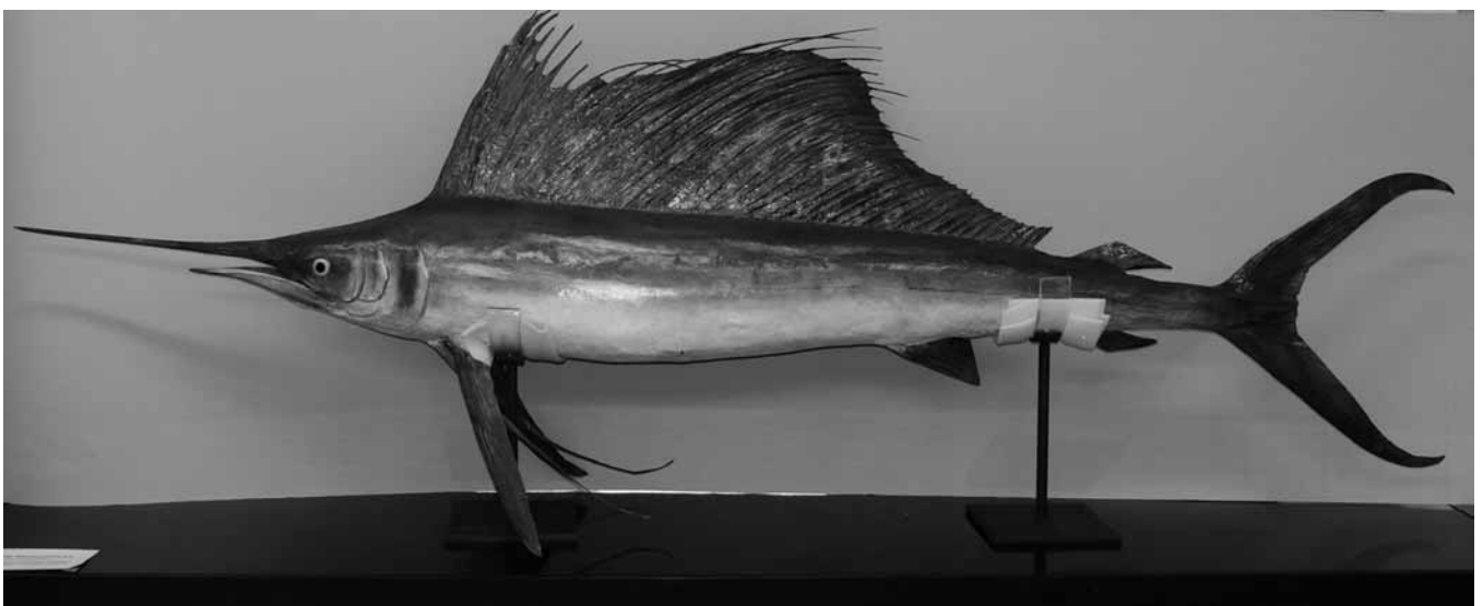
Obr. 49 – Plachetník ( Istiophorus sp.), P6V-5210, v současném stavu po restaurování