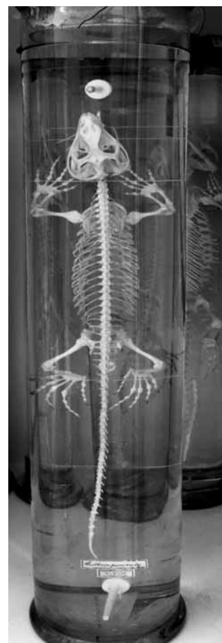
Obr. 52 – Haterie novozélandská ( Sphenodon punctatus ), P6V 5510, kostra