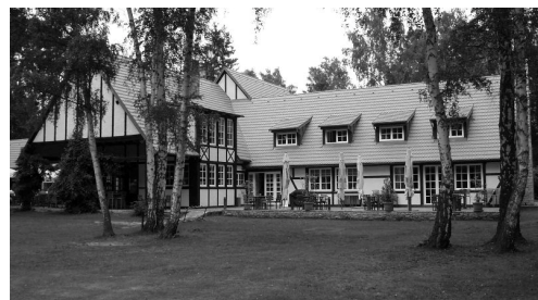
Klubovna GCP v Klánovicích, stav k r. 2009

Válečná léta rozvoj klubu zastavila. Z části klánovického hřiště se stalo skladiště aut a klubovna byla Němci využívána pro válečné účely. Mezi členy klubu, kterými se často stávali představitelé nejvyšších politických, diplomatických a kulturních kruhů se kromě spolupracovníků odboje, kteří byli popraveni či vězněni, našli také osoby spolupracující s Němci. Přesto se na malé části klánovického hřiště hrálo i za války.